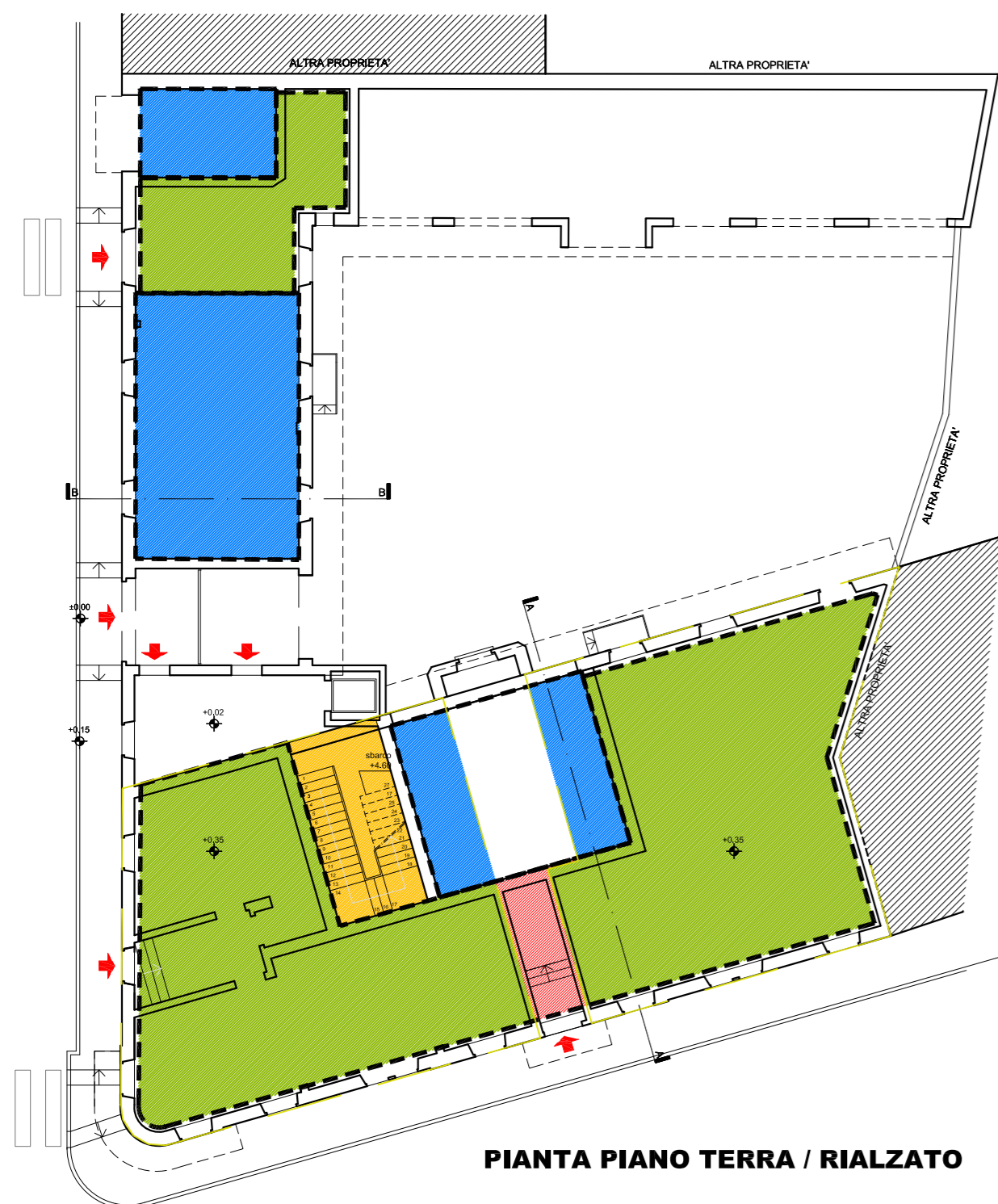
PIANTA PIANO TERRA / RIALZATO