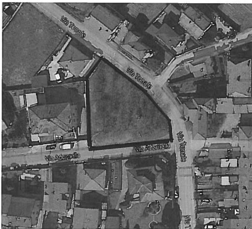
Via Adamello ang. Via Tonale