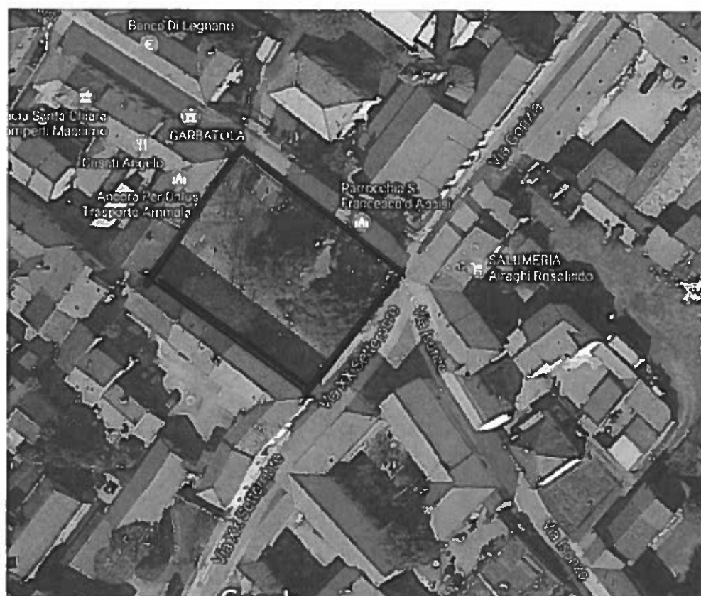
P.za Don Musazzi